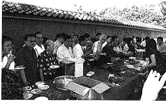
在会宁公园品尝会宁家乡小食