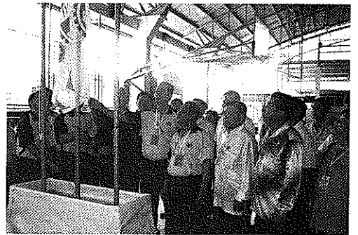
第八届2011年全砂会宁嘉年华会升旗礼