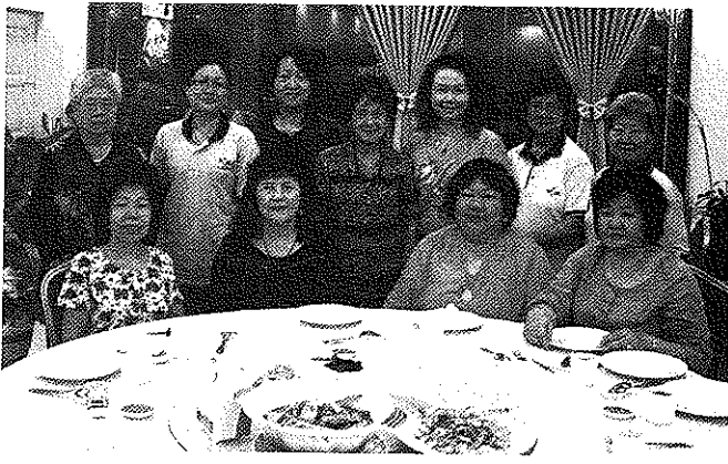
总会妇女组代表团与太平会宁妇女组合照