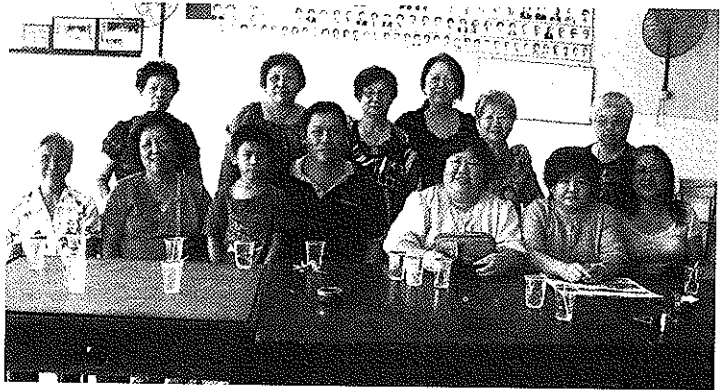
总会妇女组代表团与务边会宁同乡会合照

这次在访问期间，虽然时间安排方面有少许紧凑，但大家都觉得收获良多。在此感谢这数日来各属会的殷勤招待，盛意拳拳，十分感激。