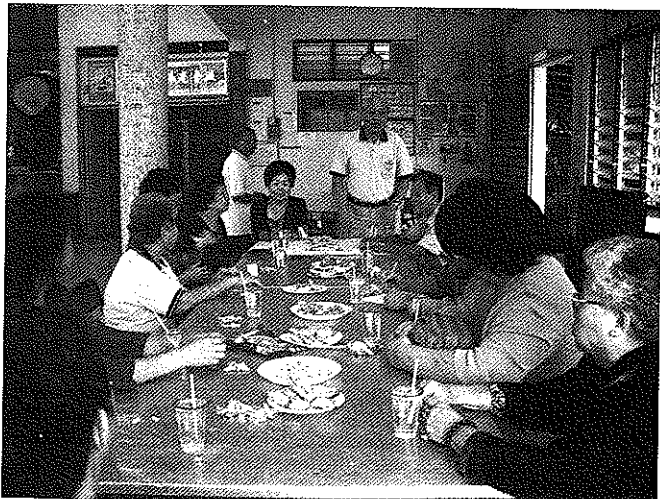
总会妇女组代表团与金宝会宁同乡会进行交流