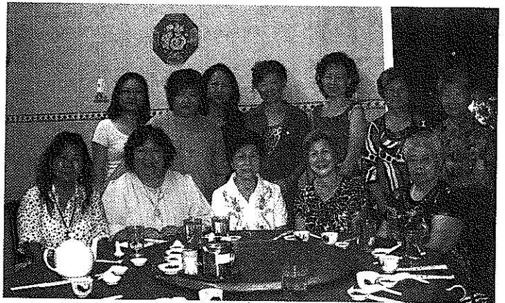
总会妇女组代表团与霹雳会宁妇女组合照