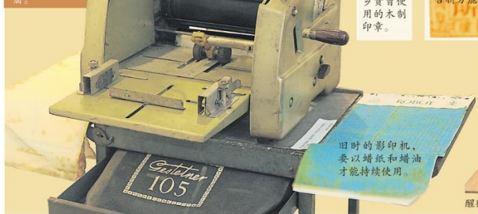
旧时的影印机，要以蜡纸和蜡油才能持续使用。