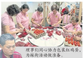
理事們同心協力包裝紅雞蛋，為踩街活動做準備。