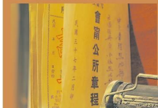
民国三十七年（1948年）会甯公所章程小册。