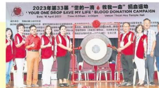
雪隆會甯公會婦女組承辦，雪隆區22個團體聯辦的第33屆「您的一滴，救我一命」捐血運動，協助國家血庫中心解決歲末期間血液短缺問題，同時締造愛心社會。

同年7月至12月，雪隆會甯公會每逢周三和周六，通過租戶萬佛緣齋菜館提供免費愛心飯盒給會所附近有需要的民眾。此舉除了有助於萬佛緣齋菜館維持生意，弱勢群體也能得到溫暖，達到雙贏局面。