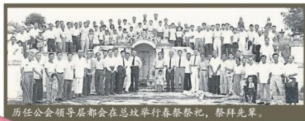
历任公会领导层都会在总坟举行春祭祭祀，祭拜先贤。

总坟的修葺和美化工程共耗资约4万令吉，并于2009年10月25日举行了圆坟仪式。