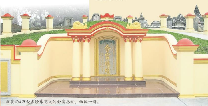
耗资约4万令吉修葺完成的会甯总坟，面貌一新。