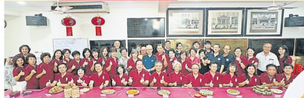
「品赏会」上合照。 一眾理事和會員在「家乡美食

为了传承家乡老味道，雪隆會甯公會于10月15日举办“家乡美食赏会”，让会员们齐聚在该会会所品赏家乡美食，一起弘扬珍贵的会宁美食文化。