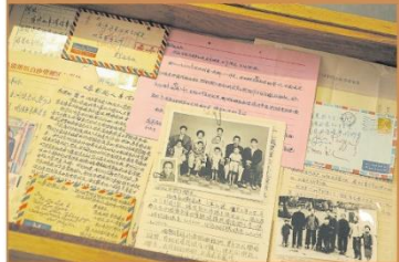
从家乡寄来的寻找南洋亲人之书信。