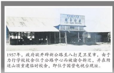
1957年，政府欲开辟新公路至八打灵卫星市，由于力行学校校舍位于公路中心而被谕令拆迁，并在附近山顶重建临时校舍，即位于国营电视台现址。

拥有84年历史、曾经历数次迁校的首邦市力行华小，如今学校硬体设备俱全，盼学生在未来可以在学术及课外活动上有更全面发展！