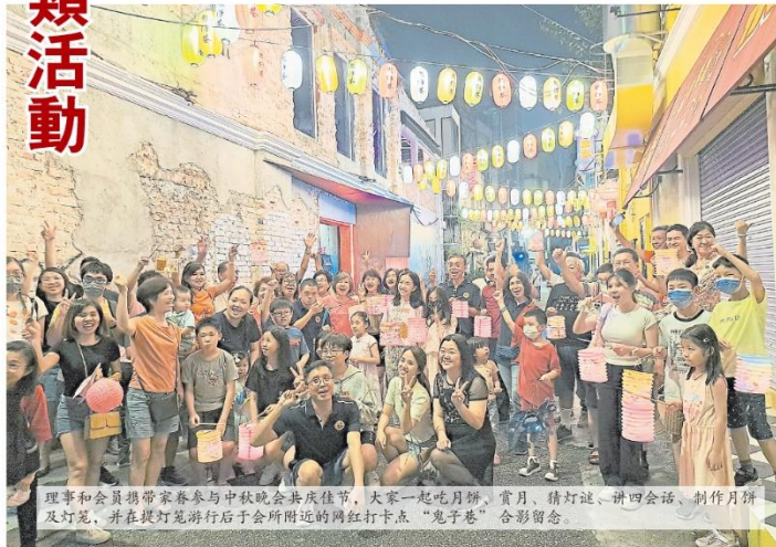
理事和會員們帶家眷參與中秋晚會共慶佳節，大家一起吃月餅、賞月、猜燈謎、講四會話、制作月餅及燈籠，並在提燈籠遊行後于會所附近的网红打卡點「鬼子巷」合影留念。

青 年團和婦女組是該會的兩大重要臂膀，一直以來積極參與協助母會推動會務，並致力於宣揚、傳承文化習俗與傳統節慶。