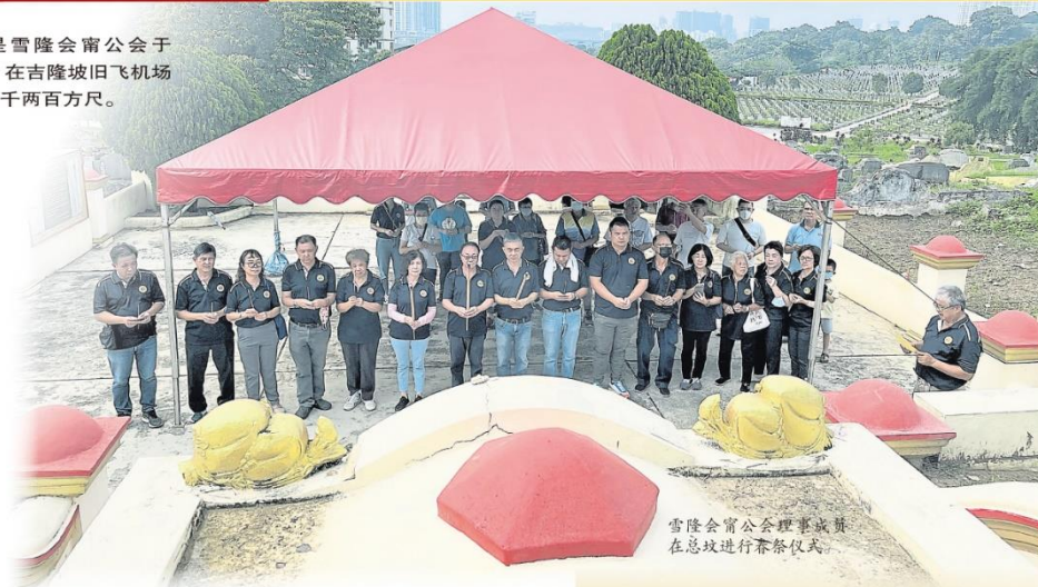
雪隆会甯公会理事成员在总坟进行茶祭仪式。