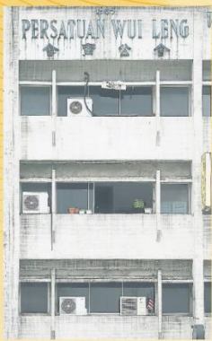
▲雪隆會甯公會會所坐落在吉隆坡市中心，見證着這座城市的發展與繁榮。