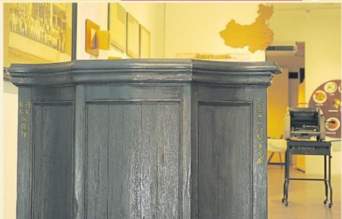
拥有100年历史的开幕讲台，仍完好保存至今。

先辈的生活足迹及所做的贡献。历史文物，让下一代能够通过文物追溯会，在时光流转中，保存了种类繁多的迈入创会100年的雪隆会甯公