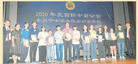
公會每年頒發獎勵金予成績優異的會員子女，激勵學子們繼續追求卓越表現。