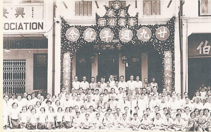
1952年，雪隆會甯公所在双层楼旧会所欢庆29周年纪念。