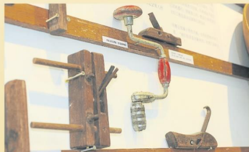
大部分男乡贤从事木工匠工，这是他们用于木材加工、装饰以及刨削等方面的各种工具。