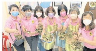
婦女組理事親身體驗四會枕頭粽的樂趣，以了解傳統文化的典故及來源，傳承中華傳統文化。

此外，公會也積極與雪隆區的華青團與婦女團體，通過聯辦或協辦的形式主辦各種文化與社會公益活動，例如「跑跑古迹，帶出關懷」千人義山行、「您的一滴，救我一命」捐血運動等，借此除了构筑友誼橋樑，增進與其他華團組織的互動交流之外，也為社會貢獻力量。