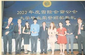
公會頒發榮譽獎予大學畢業的會員子女，以示鼓勵。