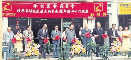
重建后的5层楼会所新大厦举行落成开幕典礼，嘉宾们主持剪彩仪式。

配合时代步伐，本会在1995年，由“雪兰莪会甯公会”易名为“雪隆会甯公会”。时至今日，会员人数达到约1086位，遍布雪隆各地。