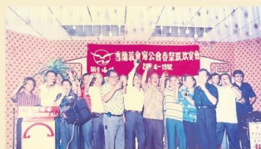
会甯公会春祭联欢宴会热闹举行，全体理事向来宾敬酒。

每年春秋两季的祭祀，雪隆会甯公会的理事和会员都会前往总坟致祭，以表达对先贤的崇敬，同时传承孝道美德，慎终追远。