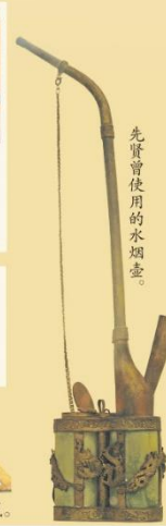
先贤曾使用的水烟壶。