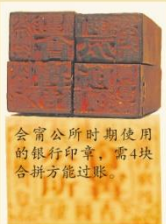
会甯公所时期使用的银行印章，需4块合拼方能过账。