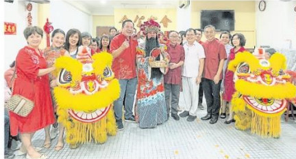
在新春團拜活動上，理事與會員們共聚一堂熱烈歡慶新春佳節，借此喚醒年輕一代了解慶祝新年的意義，繼續傳承優良傳統文化。

雪隆會甯公會為雪隆區相當活躍的社團組織之一，三機構群策群力推動會務發展、照顧同鄉會員福利、積極舉辦各種有益活動及加強對外交流，讓這家老字號公會不斷保持活力和動力，永續傳承。