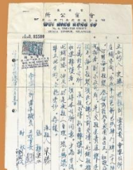
1960年，会甯公所与羊山巴新巴沙的律宋胜记签署的手写租约合同，单位至今仍租予该租户。