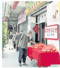
2021年疫情期間，每周2天派發「愛心粥飯盒」，讓經濟困難的群體獲得溫暖，活動持續展開了6個月。

公會在疫情時期設立「雪中炭援助金」，開放給生計受影響的會員申請，以協助他們減輕經濟壓力，發揮會甯一家親互助精神。