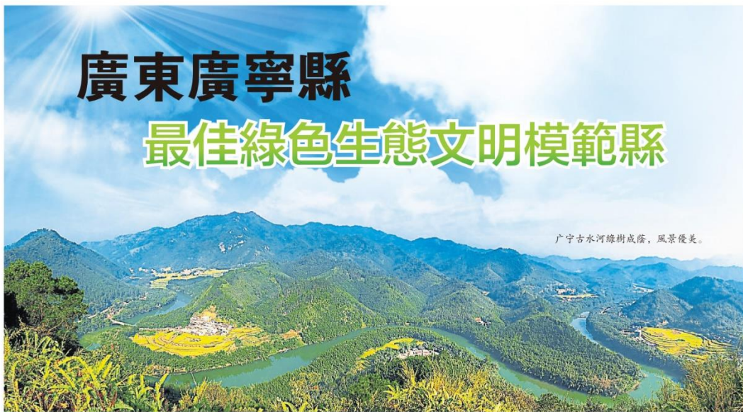
广宁古水河綠樹成蔭，風景優美。

广宁县历史文化悠久，人文底蕴深厚，各具特色的传统文化和乡镇文化在广宁得以传承和发展。