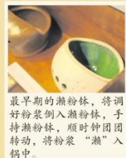
最早期的瀨粉钵，将调好粉浆倒入瀨粉钵，手持瀨粉钵，顺时针团团转动，将粉浆“瀨”入锅中。