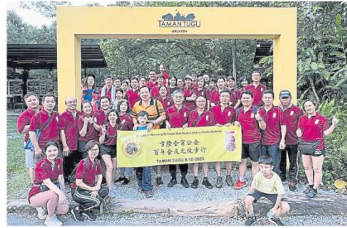
配合百年會慶，雪隆會甯公會青年團於10月8日主辦徒步行，活動吸引約70人參與，大家一起在國家紀念碑公園探索大自然和鍛煉身體。