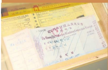
50年代雪兰莪广益银行支票。