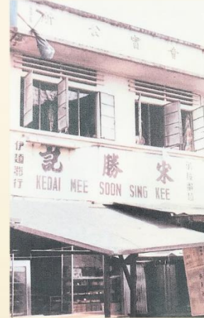
雪隆會甯公會位于吉隆坡半山芭沙律28号的产业。