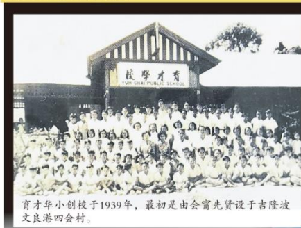
育才華小創校於1939年，最初是由會甯先賢設於吉隆坡文良港四會村。

先賢下南洋謀生，在兵荒馬亂的年代却不忘教育的重要性，在填飽肚子後即通過組織鄉親創立學府，為我國華校教育奠定了基礎；雪隆會甯公會在80年前創辦了兩間學校，如今都成為了雪隆區內出色的兩間學校，其中一間就是位於八打靈縣的育才華小。